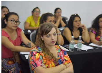
Capacitación a docentes en Arica

https://gobierno.udd.cl/noticias/2019/06/facultad-cierra-exitoso-curso-para-funcionarios-de-ecuador/