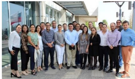
Curso para profesionales ecuatorianos