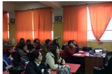
Diplomado en Lebu