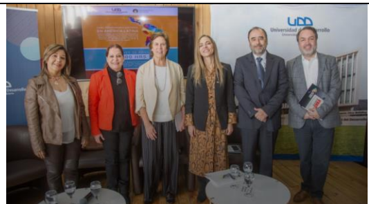
ENCUENTRO INTERNACIONAL DE DEMOAMLAT EN SANTIAGO, SE REALIZÓ EN LA UDD